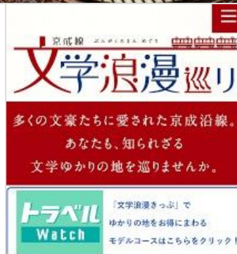
京成線 文学浪漫 きっぷ