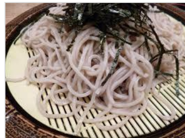
小田急線 箱根そば