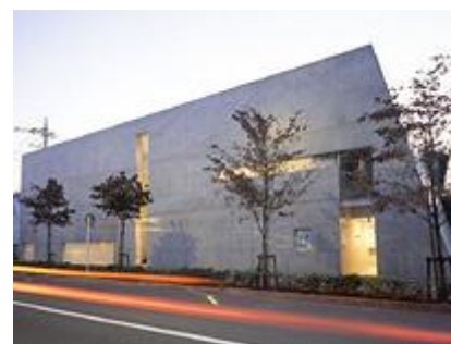
TOKYO ART MUSEUM Plaza Gallery より