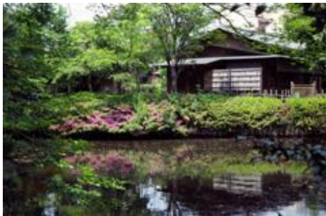
熊谷市のホームページよ