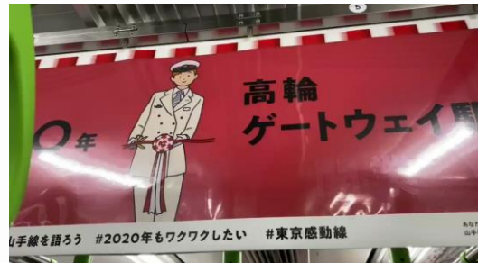
電子ペーパーを用いた 山手線の中吊り広告

その電子ペーパーを用いた中吊り広告が、この3月から暫定開業予定の新駅の高輪ゲートウェイ駅の中吊り広告として山手線の電車内に掲げられています。Twitter 上でも「すげー」「めっちゃ未来だ」と大きな話題となっているようです。