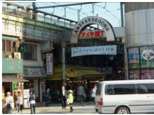
西郷隆盛像と あめや横町入口