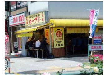
駅前の都電荒川線 とラーメンのホープ軒大塚店 (おいしかったデース。)