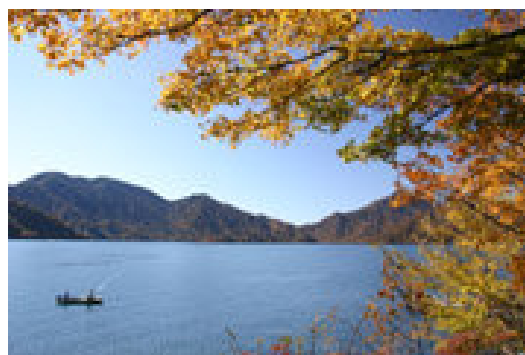
日光中禅寺湖の紅葉

「この駅やその周辺にこんなものがあるよ」などのおもしろい情報がありましたら、是非メール等でお教えてください。 (K. Y)