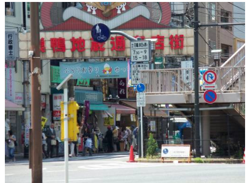
おばあさんお原宿 (巣鴨地藏通商店街)