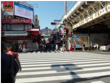
御徒町駅北口よりア メヤ横丁を望む