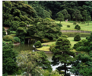
駒込駅より徒歩 7 分にある六義園