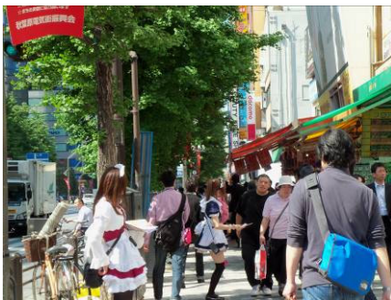
秋葉原名物 メイド喫茶のチラシ配り